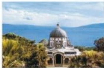
Monte de las Bienaventuranzas