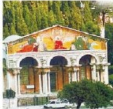
Basilica de Getsemani

Desayuno y salida hacia Betania: iglesia y tumba de Lázaro (celebración de la eucaristía). Desierto de Judea y Mar Muerto, visita de Qumran y cuevas de los manuscritos del Mar Muerto. Traslado a Jericó. Almuerzo. Parada en el río Jordán: renovación de promesas bautismales. Regreso a Jerusalem. Cena y alojamiento.