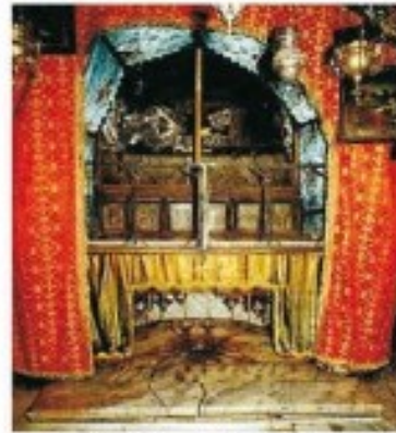
Belén, Altar de la Natividad