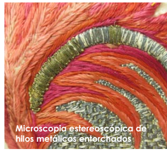
Microscopía estereoscópica de hilos metálicos entorchados