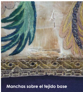
Manchas sobre el tejido base

En general, la mayoría de forros estaban provocando tensiones y deformaciones en la parte inferior de las piezas por ser de dimensiones más reducidas que estas.