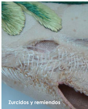
Zurcidos y remiendos