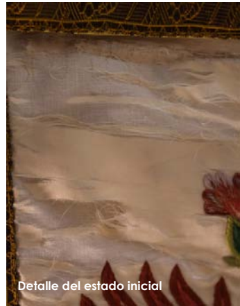
Detalle del estado inicial