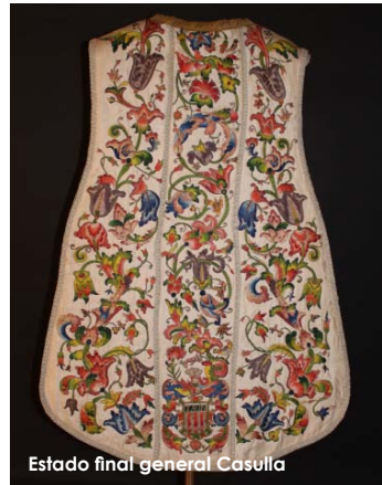
Estado final general Casulla