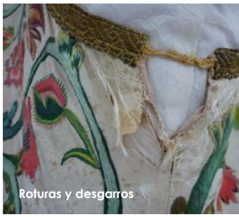
Roturas y desgarros