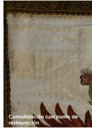
Consolidación con punto de restauración