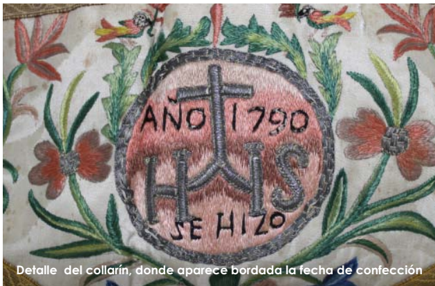
Detalle del collarín, donde aparece bordada la fecha de confección

La parroquia de san Josemaría Escrivá de Valencia posee un interesante Terno de Gloria, fechado en 1790, que se compone de: una capa pluvial en cuyo capillo puede verse el escudo de la orden franciscana; una casulla, que fue renovada en 1892 según se lee en ella; dos dalmáticas; dos collarines; un manipulo y una estola, todos ellos confeccionados en un tejido adamascado de seda de color crudo, con bordados de sedas policromas e hilos entorchados y laminillas metálicas, que representan motivos vegetales de flores y zarcillos entrelazados y aves, insectos y otros animales, galón metálico y aplicación de pasamanería.