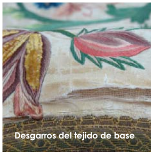
Desgarros del tejido de base