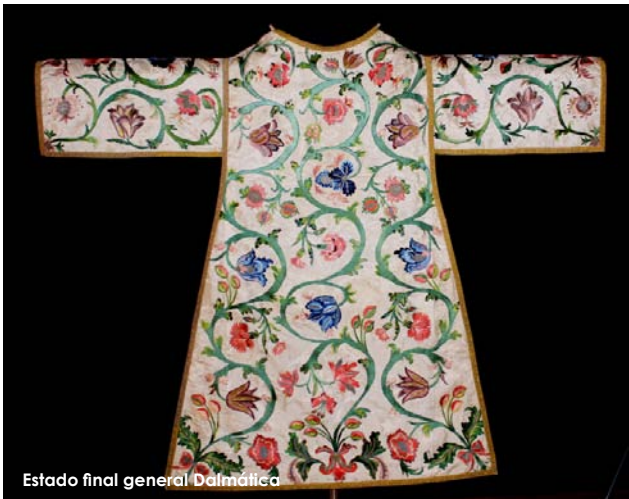
Estado final general Dalmática

Este interesante terno ha sido restaurado gracias a una subvención de la Diputación de Valencia, y los trabajos de restauración han sido realizados por el Institut Valencià de Conservació i Restauració de Béns Culturals de la Generalitat Valenciana.