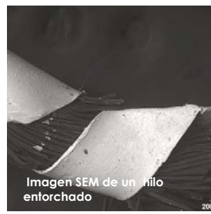
Imagen SEM de un hilo entorchado