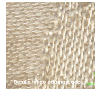
Detalle tejido adamascado