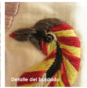
Detalle del bordado